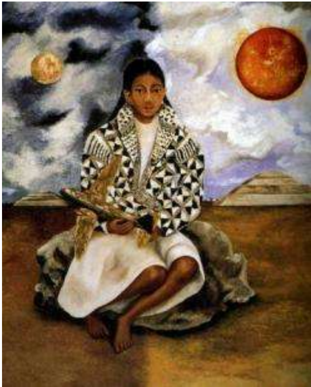
Cuadro de FRIDA KAHLO