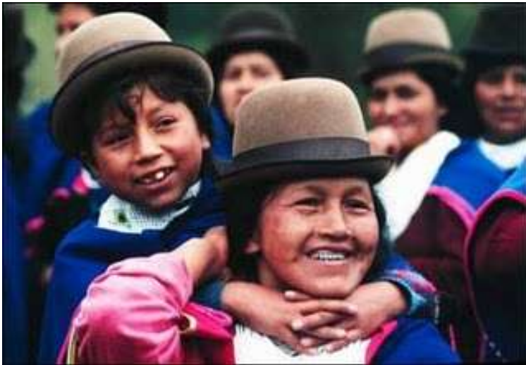
"Indígenas guambianos", Colombia