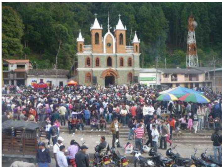
Bingo en La Vega-Cauca.